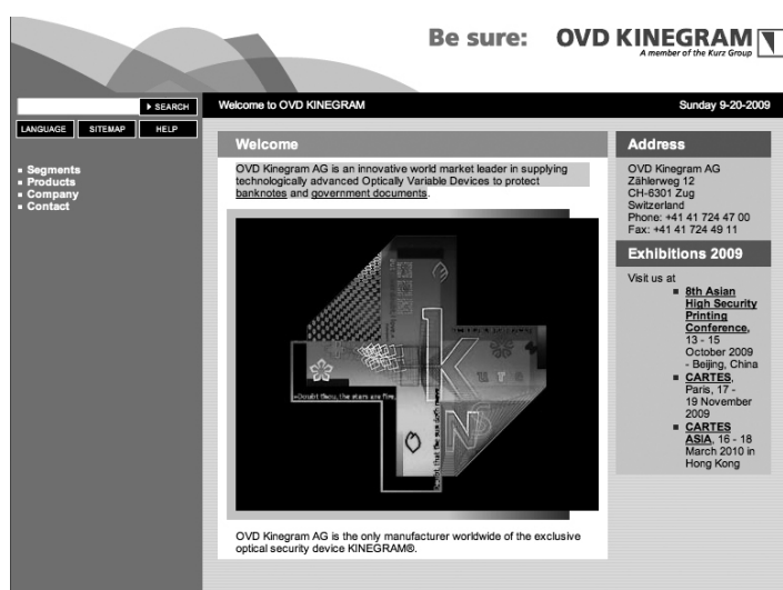
Abb. 3: Website Kinegram, http://www.kinegram.com/ , 04.11.2009. 18

den staatlichen wie ökonomischen Strukturen moderner Gesellschaften aus. 16 Das heterogene Ensemble der reproduktiven Differenz ist eine Weise der – um es mit Foucault (1991: 26) zu sagen – »Verknappung«, ohne die weder der Geldverkehr, noch die personale Identität, noch der Warenverkehr aufrechterhalten werden können. 17 Ähnlich schrieb Niklas Luhmann: »In der Form von Geld erscheint das Medium als künstlich knapp. Man könnte die Geldmenge variieren« (Luhmann 1994: 197). Solche Verknappungen scheinen je nach Praxis oder Subsystem mehr oder weniger eine dringliche Notwendigkeit zu sein. Zu behaupten, die Differenz von Original und Kopie sei heute obsolet, ist schlichtweg Unsinn. Ganze Industrien sind entstanden, die mit dem Verhindern des Kopierens und mithin der Stabilisierung eines Originals ihr Geld verdienen – wozu in gewisser Weise übrigens auch die Verhütungsmittelindustrie zählt, insofern sie die Kopie genetischer Codes verhindern soll.