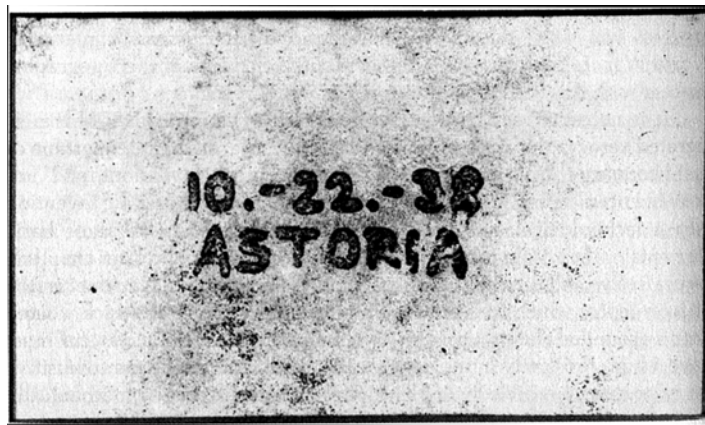
Abb. 6: Erste Fotokopie, aus: Owen 2005: 98.

Reproduzierbarkeit. Jedenfalls aus Sicht der Bundesdruckerei und ähnlicher Institutionen. 30 Diese Maschine wird gefürchtet 31 – auch von Diktaturen, wo Fotokopierer für den Privatgebrauch nicht zugänglich waren und sind (vgl. Arns/Broeckmann 1998). Deswegen gibt es in einigen, nicht allen heutigen Fotokopierern lange geheimgehaltene Schutzvorrichtungen, die es unmöglich machen, mit dem Kopierer z.B. einen Geldschein zu fotokopieren. Diese Maschinen, aber auch Adobe Photoshop ab Version 7, erkennen die Banknote anhand der von der Central Bank Counterfeit Deterrence Group entwickelten sog. EURion-Konstellation sowie anderer Merkmale und blockieren den Vorgang. 32 Auch ein Kampf um die reproduktive Differenz – in Wired erschien bald ein Artikel darüber, wie man diese Verfahren umgehen kann (vgl. Leyden 2004; Ulbrich 2004).