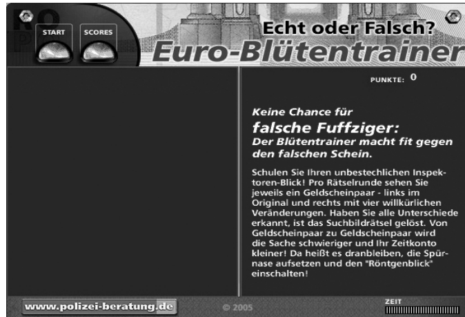
Abb. 1: Euro-Blüten-Trainer, Screenshot, http://bluetentrainer.polizei-beratung.de/blueten_euro/trainer_d.html , 04.11.2009.

Zu dieser Didaktik zählen auch die Film- und Plakatkampagnen wie »Raubkopierer sind Verbrecher« (Abb. 2), links aus der Originalkampagne, rechts eine äußerst problematische, aber in ihrer Drastik auch bezeichnende, Parodie – gefunden im Internet. Diese und ähnliche disziplinarische Paratexte sind wichtig, denn selbst die unwissentliche Weitergabe von Falschgeld wird – und damit sind wir wieder bei den Juristen – schwer bestraft, mit bis zu fünf Jahren Gefängnis. Das gilt für jeden von uns: Es ist unsere Pflicht, selbst die Körper- und Aufmerksamkeitstechniken zu erlernen, die uns helfen jene selbst juristisch geschützten technischen Effekte zu erkennen, die den juristisch strafbaren Tatbestand der unzulässigen Reproduktion von Geld oder Dokumenten markieren.