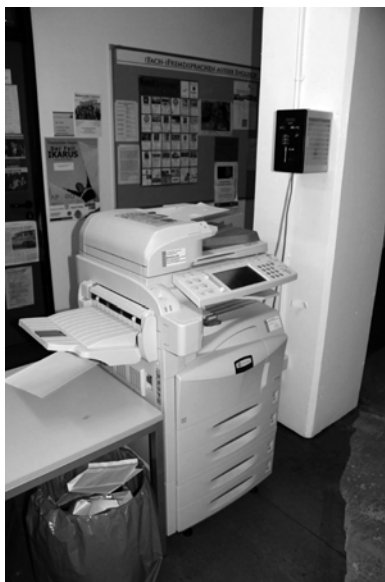
Abb. 5: Fotokopierer vor dem Sekretariat des Dekanats des FB3, Universität Siegen, 2009.

das Identigram® erarbeitet. Damit haben wir nachhaltig zur Fälschungssicherheit von deutschen Reisepässen und Personalausweisen beigetragen.« 28