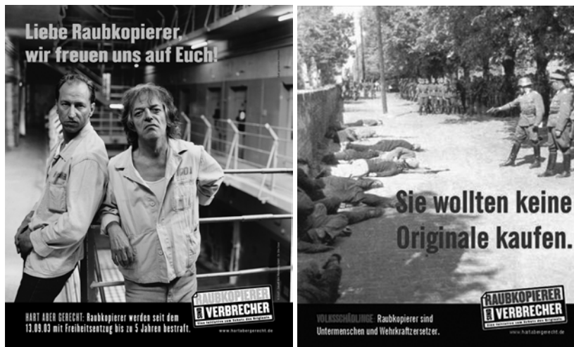
Abb. 2: „Raubkopierer sind Verbrecher“ und Parodie, gefunden im Internet.

Zu dieser Didaktik zählen auch die Film- und Plakatkampagnen wie »Raubkopierer sind Verbrecher« (Abb. 2), links aus der Originalkampagne, rechts eine äußerst problematische, aber in ihrer Drastik auch bezeichnende, Parodie – gefunden im Internet. Diese und ähnliche disziplinarische Paratexte sind wichtig, denn selbst die unwissentliche Weitergabe von Falschgeld wird – und damit sind wir wieder bei den Juristen – schwer bestraft, mit bis zu fünf Jahren Gefängnis. Das gilt für jeden von uns: Es ist unsere Pflicht, selbst die Körper- und Aufmerksamkeitstechniken zu erlernen, die uns helfen jene selbst juristisch geschützten technischen Effekte zu erkennen, die den juristisch strafbaren Tatbestand der unzulässigen Reproduktion von Geld oder Dokumenten markieren.